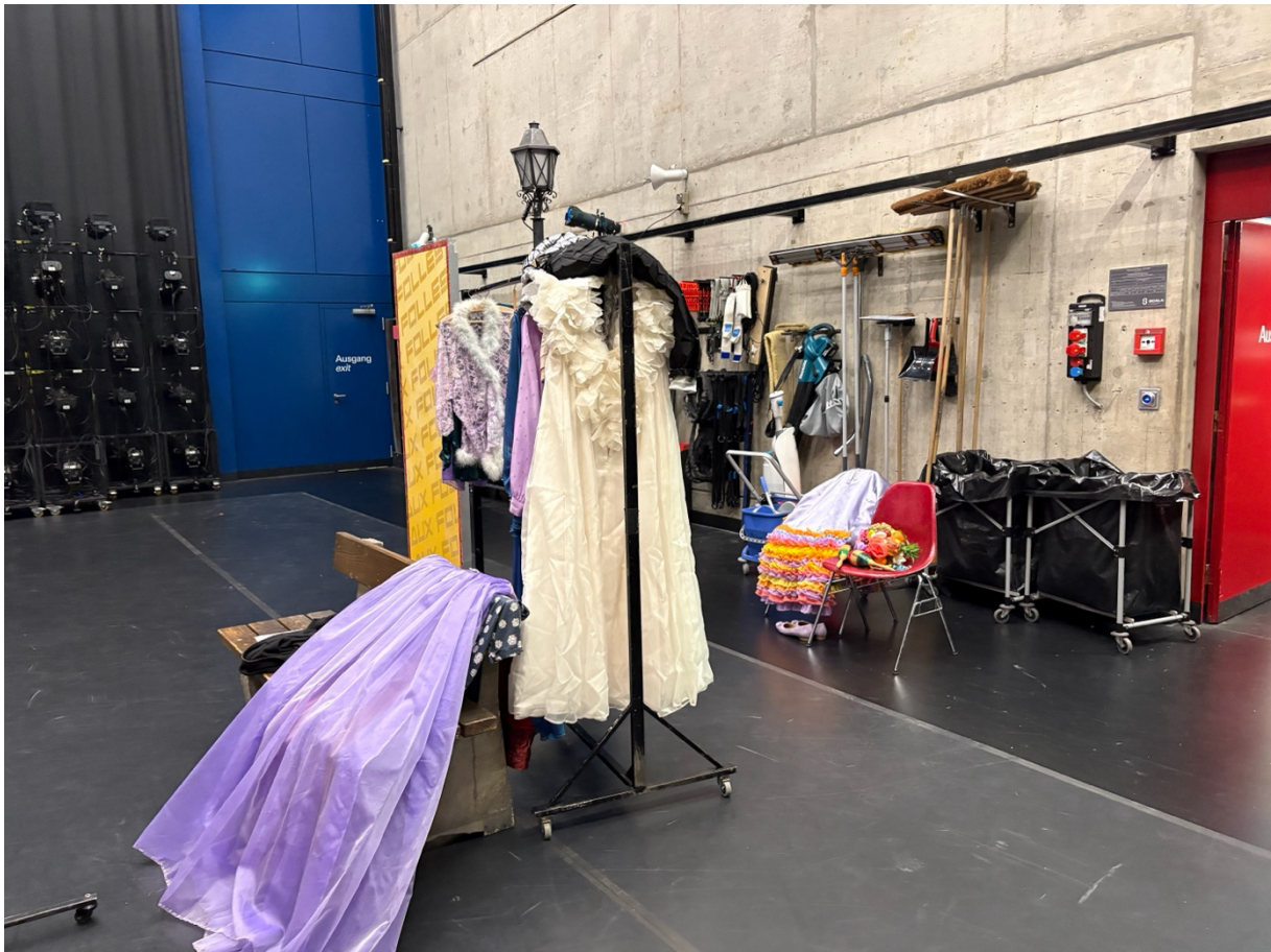
Hinter der Bühne im Theater Winterthur: Requisiten und Kostüme stehen bereit und warten auf ihren Einsatz.

In diesem Moment tritt eine Schauspielerin hektisch zu ihm und meldet, dass ein Kostüm fehlt. Struffolino hört zu, organisiert Hilfe und kehrt zu seinem Ablauf zurück. Wenig später taucht das Kostüm auf. Die Szene läuft weiter. Nach über 20 Jahren im Beruf sei man sich solche Situationen gewohnt. «Da musst du einen kühlen Kopf bewahren», sagt er.